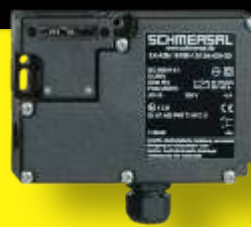
Interblocchi & Sensori