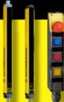
Barriere Ottiche Pannello BDF